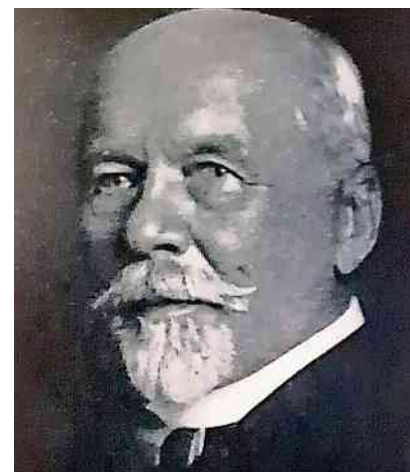
Hermann Müller-Thurgau - ein Universalgelehrter aus unserem Dorf.

ne ganze Lehr- und Versuchsanstalt aufgebaut und zählte zu den angesehensten Universalgelehrten der Schweiz.