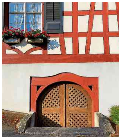
Eingang zum Keller Müller-Thurgau-Haus Nordseite.

Eines vorweg: Müller-Thurgau war ein Forscher der absoluten Sonderklasse. Er hatte mehr als 400 wissenschaftliche Arbeiten veröffentlicht, hatte eine bedeutende Forschungsstation in Geisenheim (D) und später in Wädenswil am Zürichsee ei-