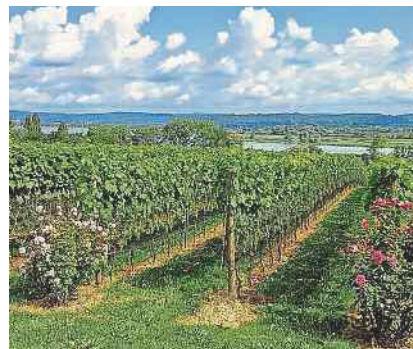
Der Rebhang Nüüsatz an guter Lage westlich vom Dorf.

Die Aufgabe in Wädenswil war für Müller-Thurgau wesentlich anspruchsvoller: Er hatte die gesamte Forschungsanstalt und nicht 'nur' ein Institut aufzubauen. Eine Herkulesaufgabe, der sich Müller-Thurgau mit der ihm eigenen Kraft und Ausdauer stellte und die Lehr- und Versuchsanstalt erfolgreich entwickelte.