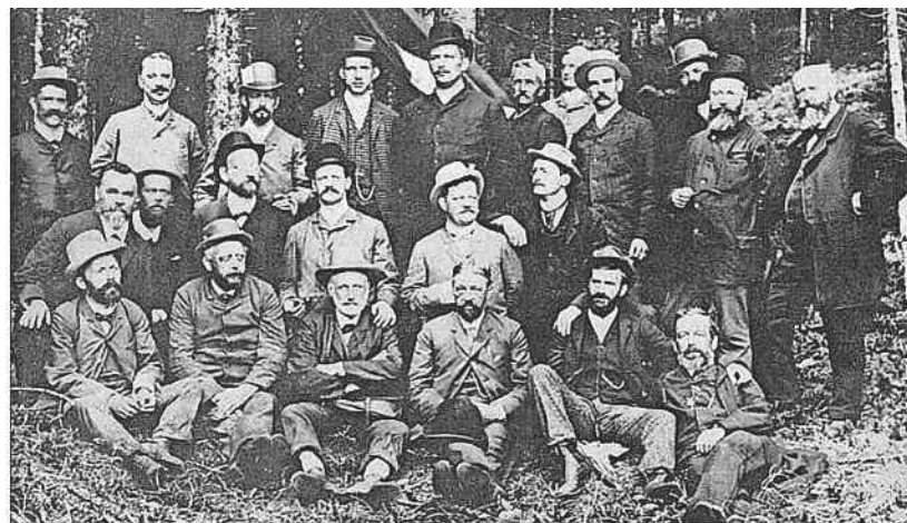
Taufakt der Subsektion Hoher Rohn, 7. Juni 1891.

Auch im Alpenclub aktiv: 1895 bis 1899 Präsident der SAC-Sektion Hoher Rohn (sitzend, 1. von links).